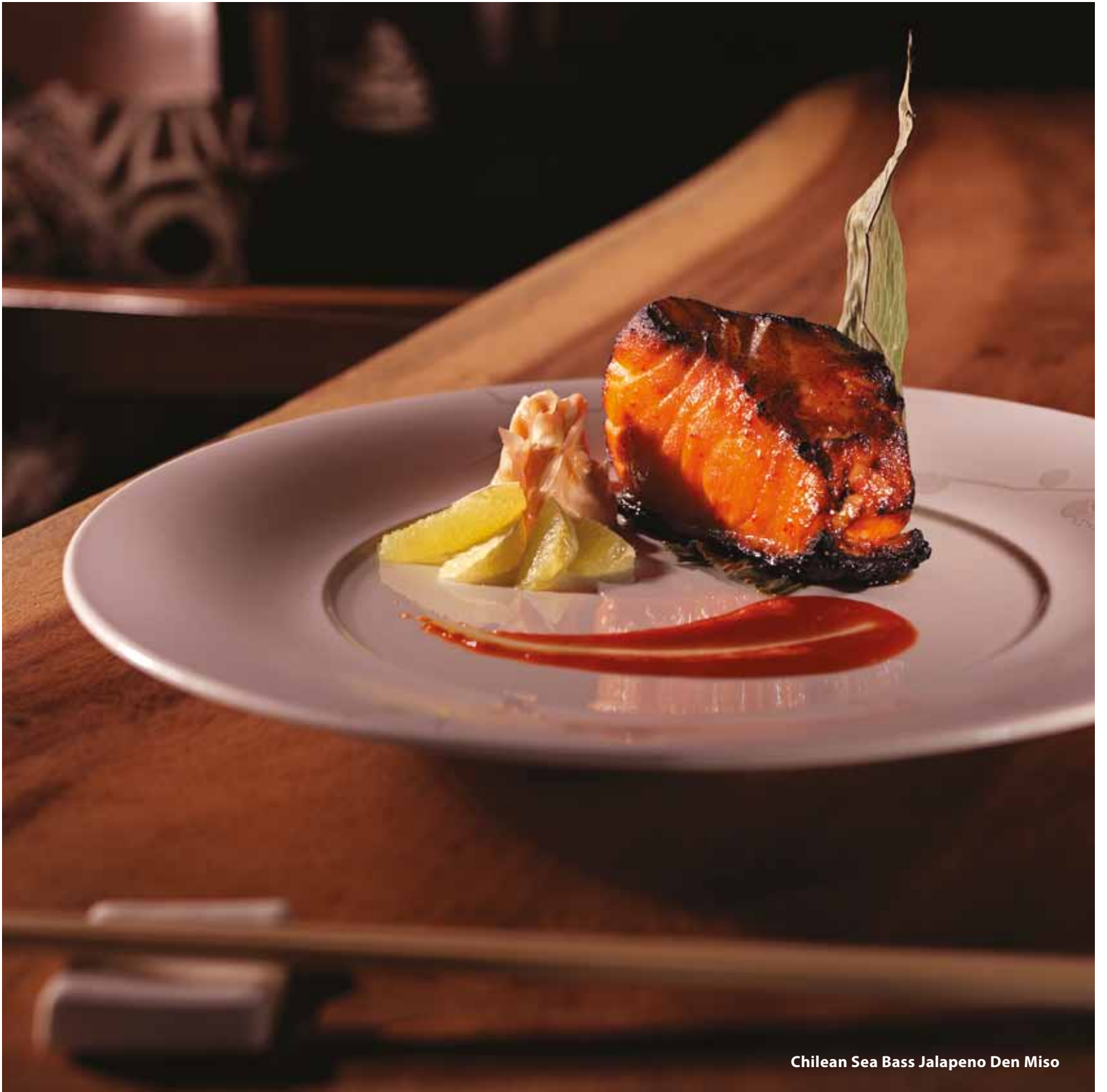
Chilean Sea Bass Jalapeno Den Miso