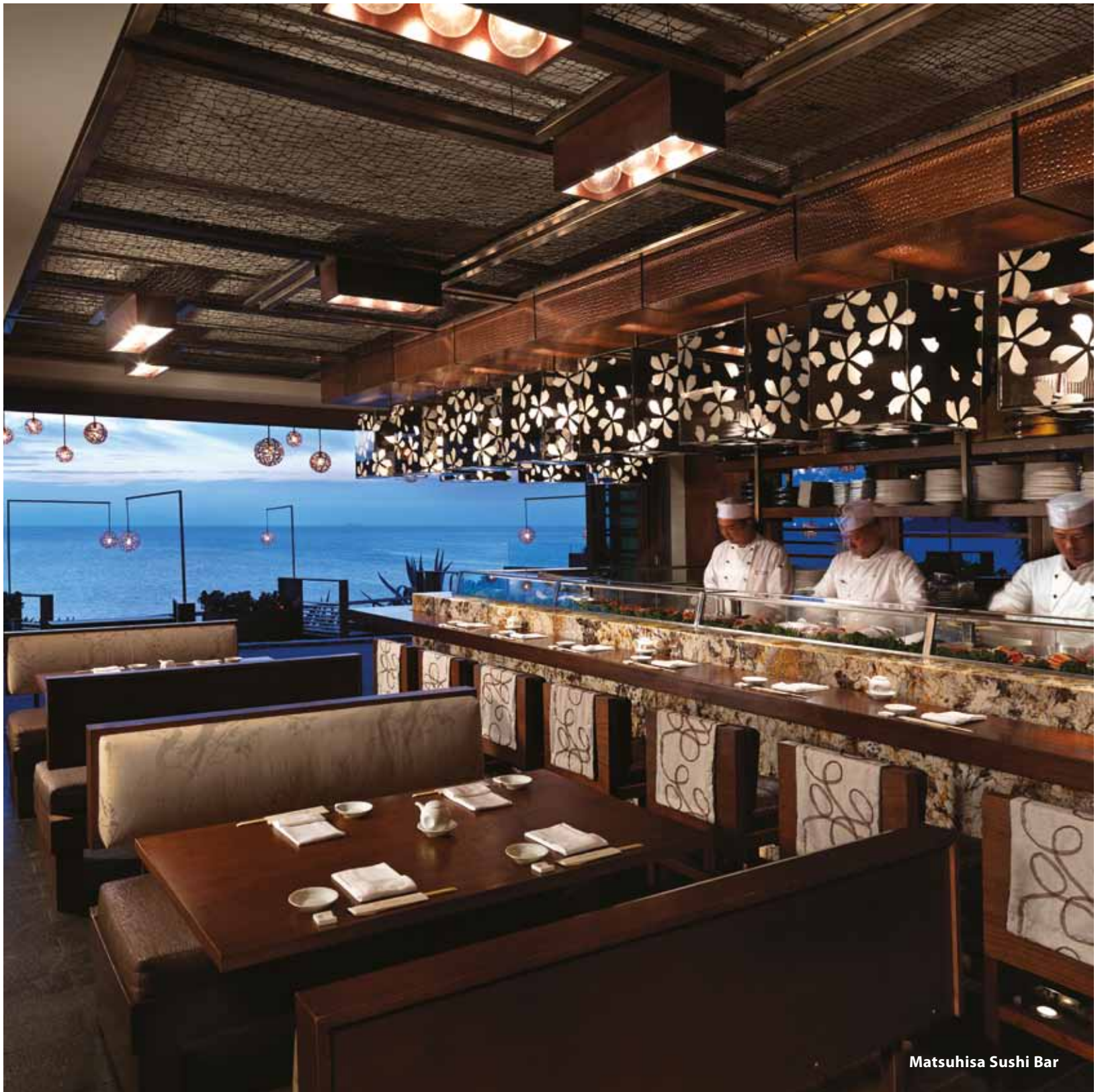
Matsuhisa Sushi Bar