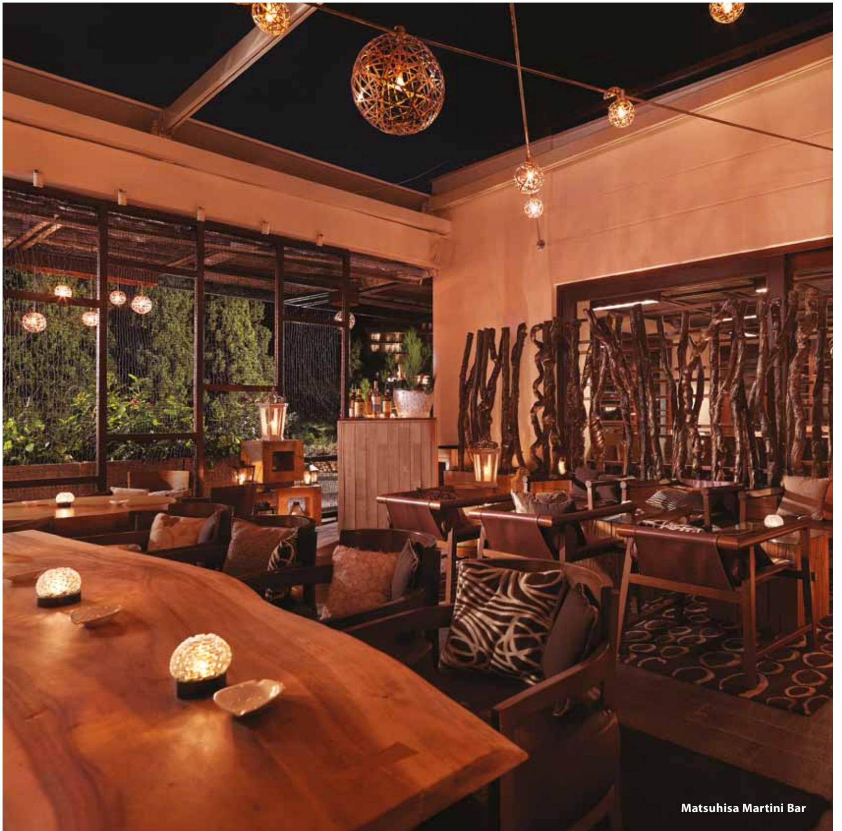
Matsuhisa Martini Bar